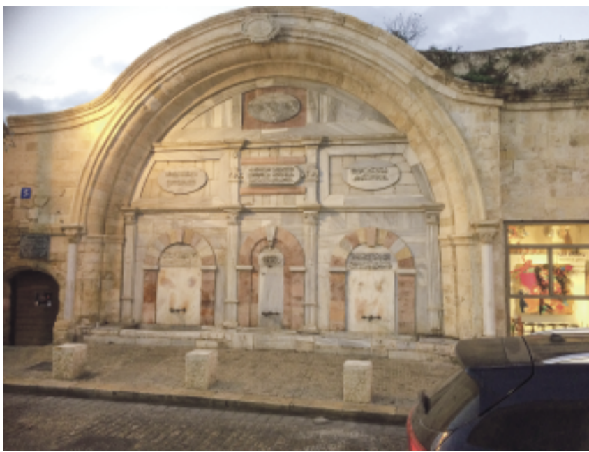
Wasch-Station Mahmodiya-Moschee in Jaffo

Nicht erst seit dem Anschlag vom 7. Oktober 2023 durch die Hamas und danach seit Israels Invasion des Gaza-Streifens stellt sich manchem Christen von Neuem die Frage: Wie stehen wir zu den Juden? Eine Frage, die uns seit der Zeit der Apostel bewegt. Seit 75 Jahren stellt sich die Lage noch komplizierter dar: Wie stehen wir zum Staat Israel?