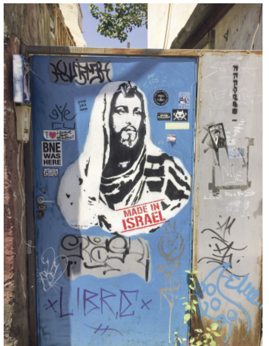
Jesus-Graffiti in Neve Tzedek, Tel Aviv