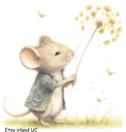
Etsy irland UC

Montag, 8. Januar 2024, 9.00 – 11.00 Uhr im Oeki