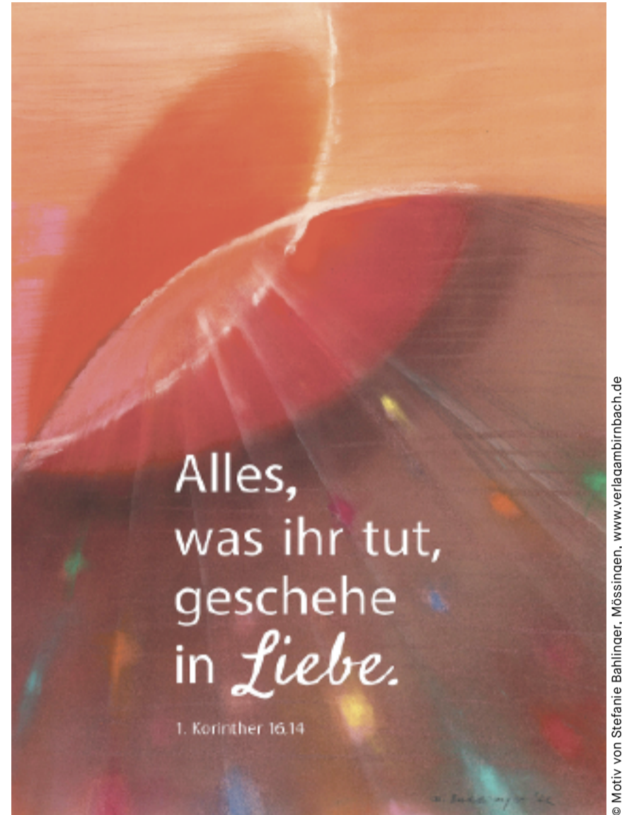
© Motiv von Stefanie Bahlinger, Mössingen, www.verlagambirnbach.de